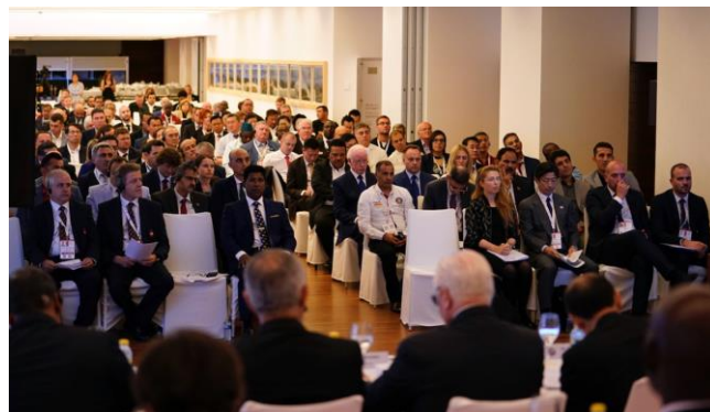
WKFの最高意思決定機関である総会は、各NFの代表者の出席によって成立する。